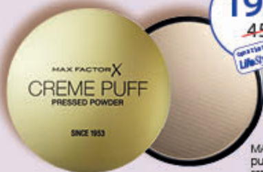
MAX FACTOR CREME PUFF puder/podkład, 21 g cena za 100 g = 66,19 zł