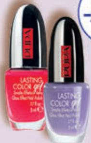
PUPA LASTING COLOR GEL lakierzy do paznokci, 6 ml