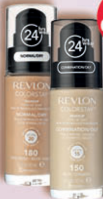
REVLON COLORSTAY podkłady do twarzy, 30 ml