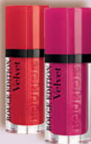
BOURJOIS ROUGE EDITION VELVET pomadki do ust, 6,7 ml