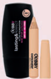
Podkład Lasting&Perfect 30 ml + korektor w prezencie