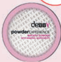
Puder Transparentny Mat&Fix 8,5 g