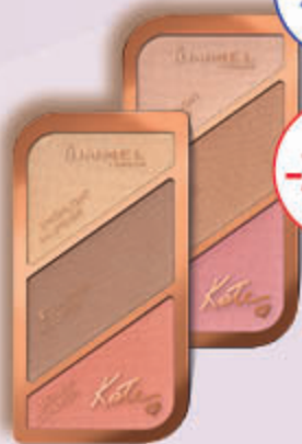
RIMMEL KATE paletki do konturowania twarzy, 1 szt.