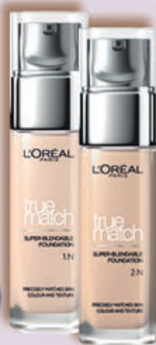
L'ORÉAL TRUE MATCH podkłady do twarzy, 30 ml