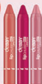
Matowa Pomadka Lip Chubby 3,6 g