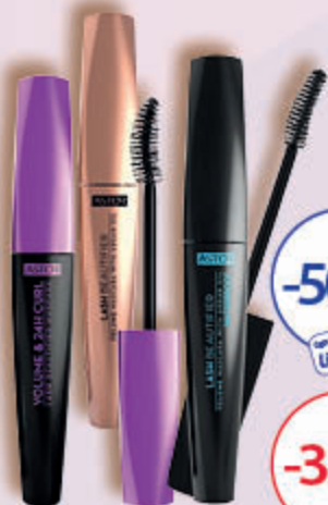
ASTOR LASH BEAUTIFIER maskary, 10 ml