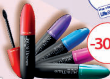
REVLON wybrane maskary do rzęs, 8,5 ml